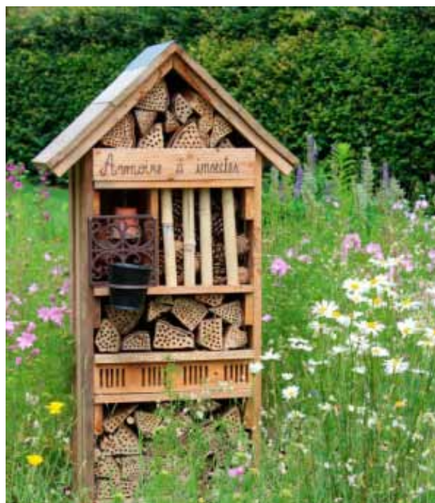
▲ Hôtel à insectes

• Les hôtels à insectes. Fabriqués en Belgique, ces hôtels sont réalisés sur mesure, selon les besoins et selon les insectes. Réalisés en mélèze issu de forêts gérées durablement, ces hôtels seront l'occasion d'en savoir davantage sur ces hôtes du jardin, alliés du jardinier !