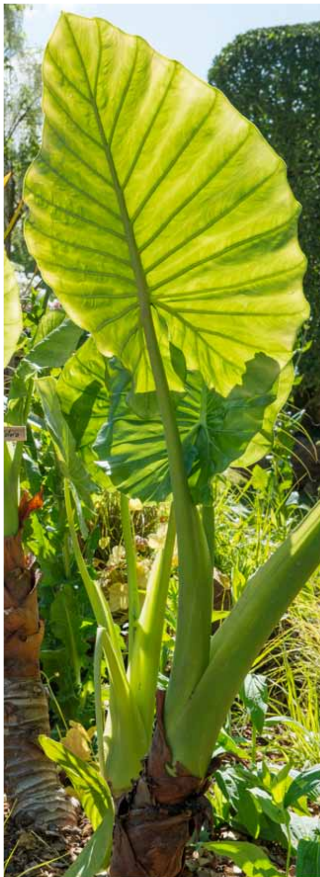
▲ Alocasia « Calidora »

• Cannebeth fête son trentième anniversaire ! L'occasion de présenter une partie de leurs collections de bougainvilliers et de Lantana telles qu'elles sont aménagées par thèmes dans le Tjardin avec un accent sur les couleurs et l'esprit de collection. Le thème « plantes et transmission » sera mis en scène autour du credo revendiqué par la pépinière « le végétal est porteur d'humanité ».