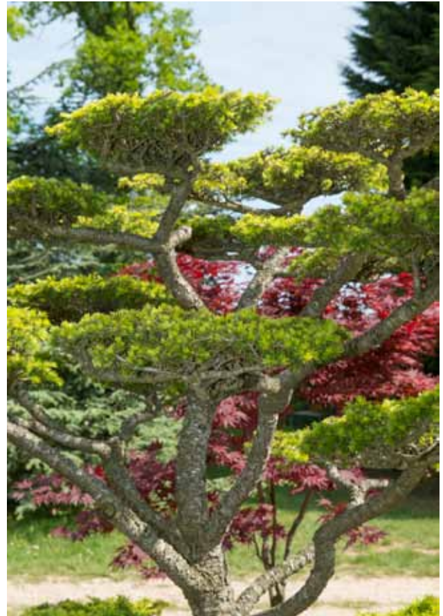
▲ Arbre taillé en nuages

Des variétés nouvelles et inédites ou rares présentées chez Boos Hortensia dont le Mérite de Courson, printemps 2014 H. macrophylla 'Wedding Gown' ou celui du printemps 2013, H. paniculata 'Sparkling'. Les Hortensias du Haut-Bois proposeront des sujets adultes exceptionnels par leur taille mais aussi des jeunes plants de 2 ans.