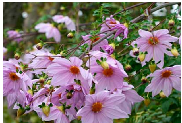
▲ Dahlia imperialis

Après une campagne de restauration et de restitution entreprise entre 2011 et 2013, le Jardin Anglais s'apprête à accueillir deux fois par an, les Journées des Plantes de Courson transmises, désormais, au Domaine de Chantilly.